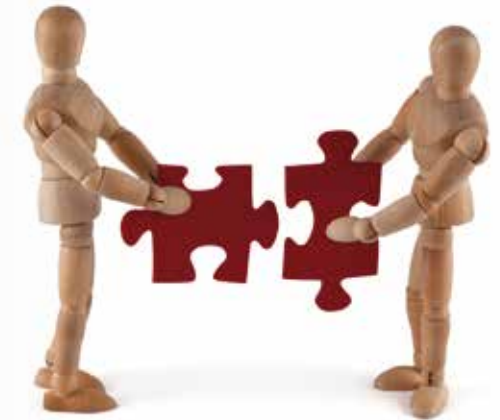
Bild: Wooden Mannequin and new solution [18877568] ©iStockphoto.com/kerrick

Psychodramatische Selbsterfahrungsgruppe